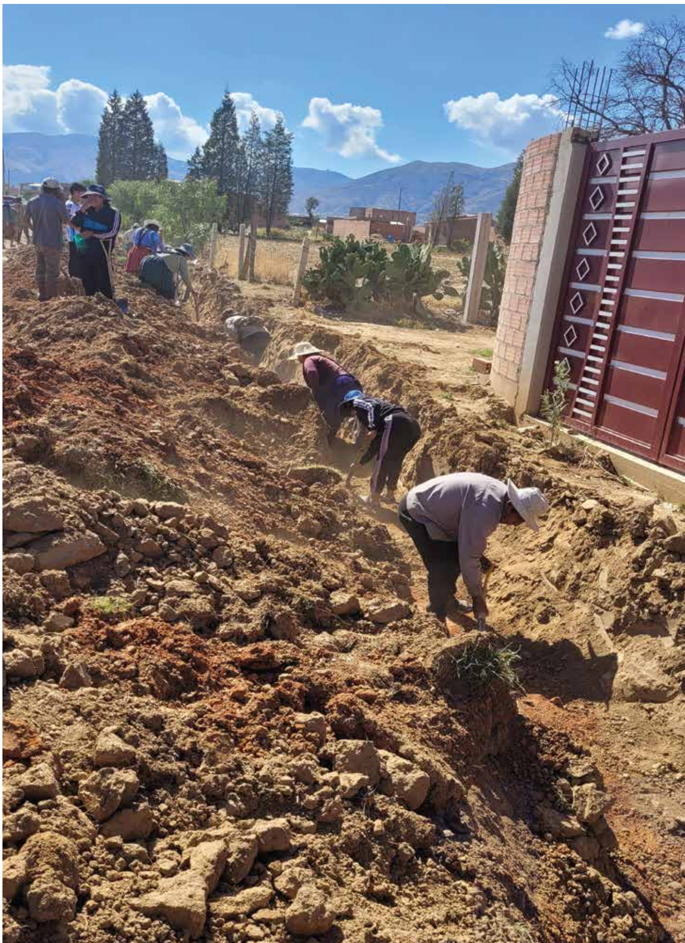
Mejoramiento de la red de agua potable, OTB Alalay 2023