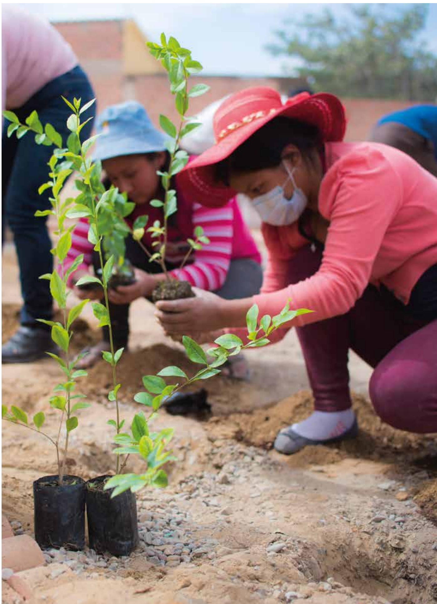
Reforestación parque de bolsillo, OTB Alalay, 2021