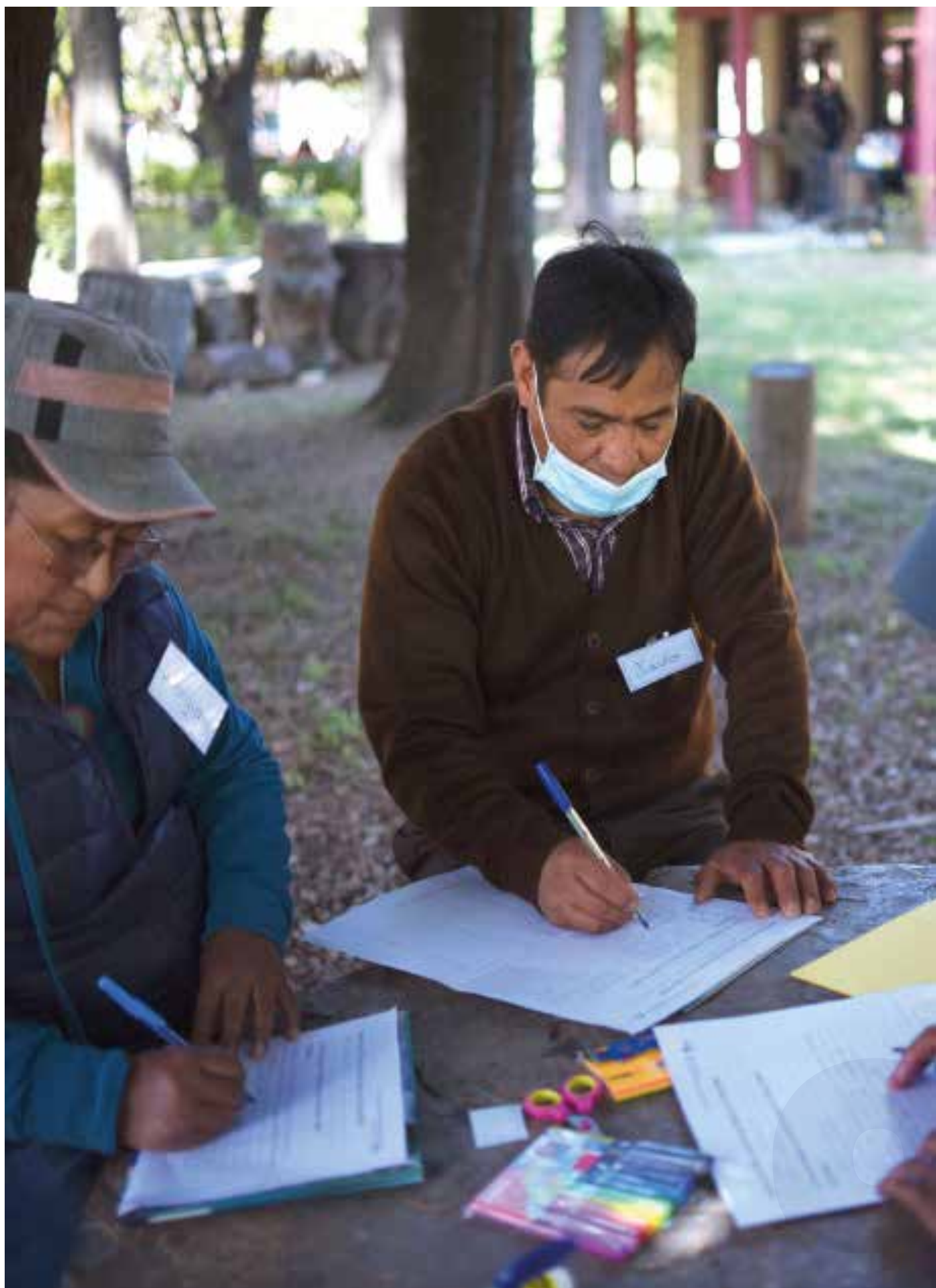
Taller de Liderazgo CUS, 2022.