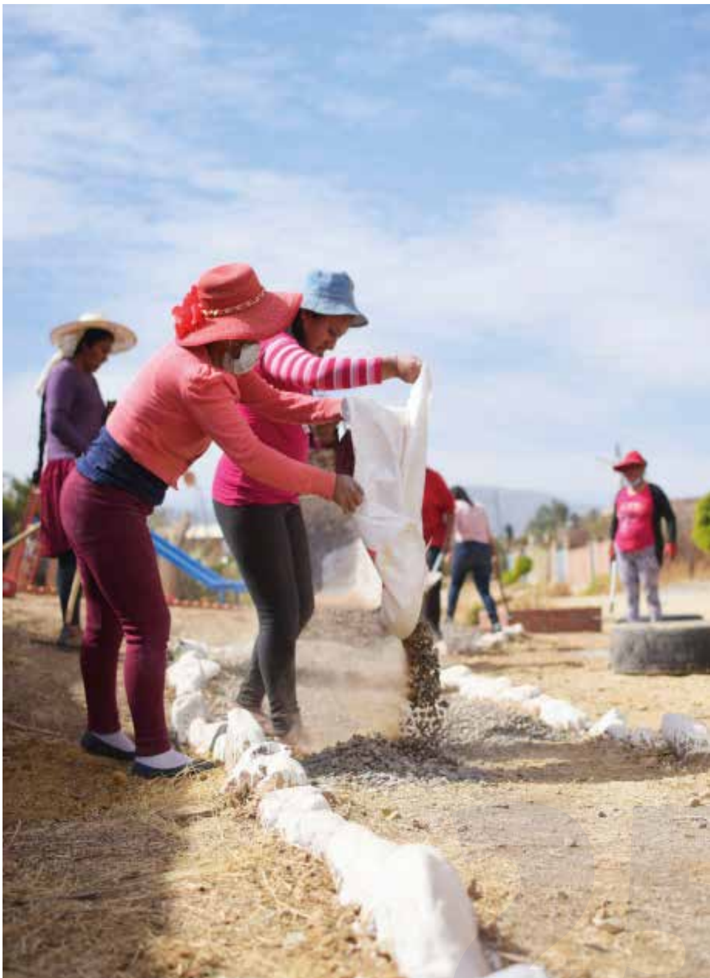
Jornada de limpieza parque de Bolsillo OTB Alalay - Sacaba