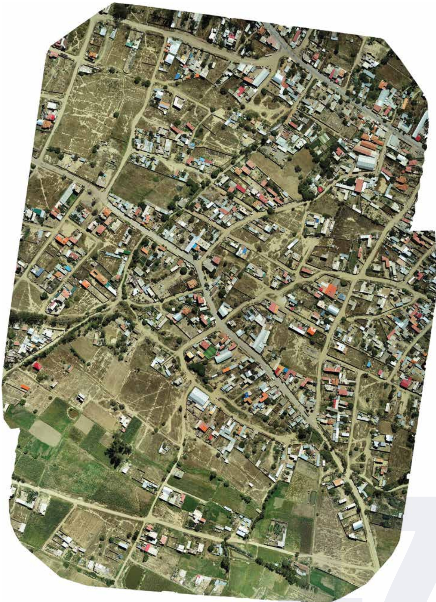
Ortofoto OTB Tacopoca Alta, 2022