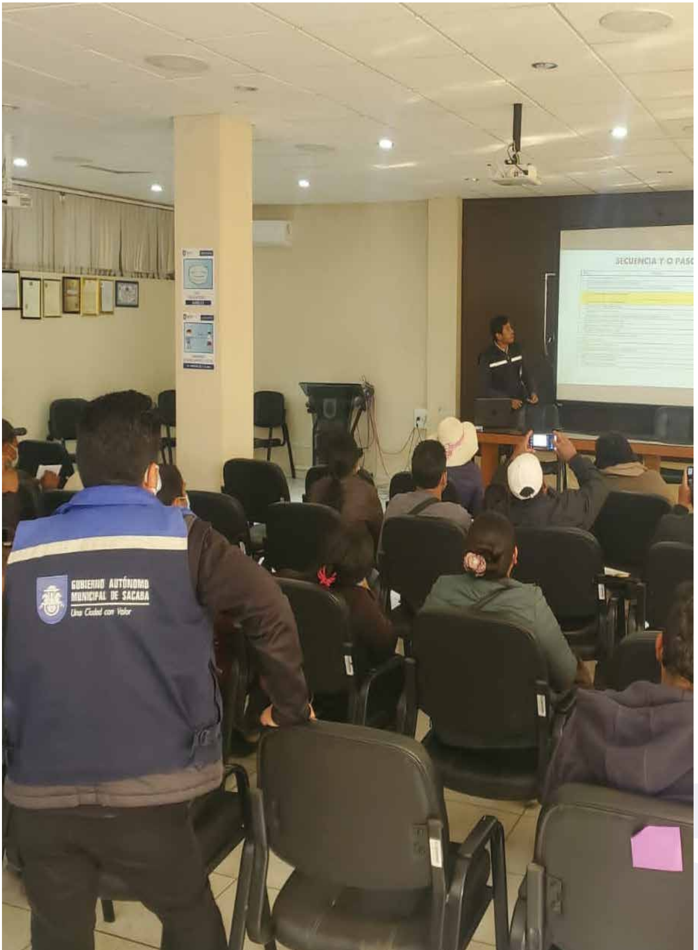
Trabajo coordinado con GAM Sacaba, 2022