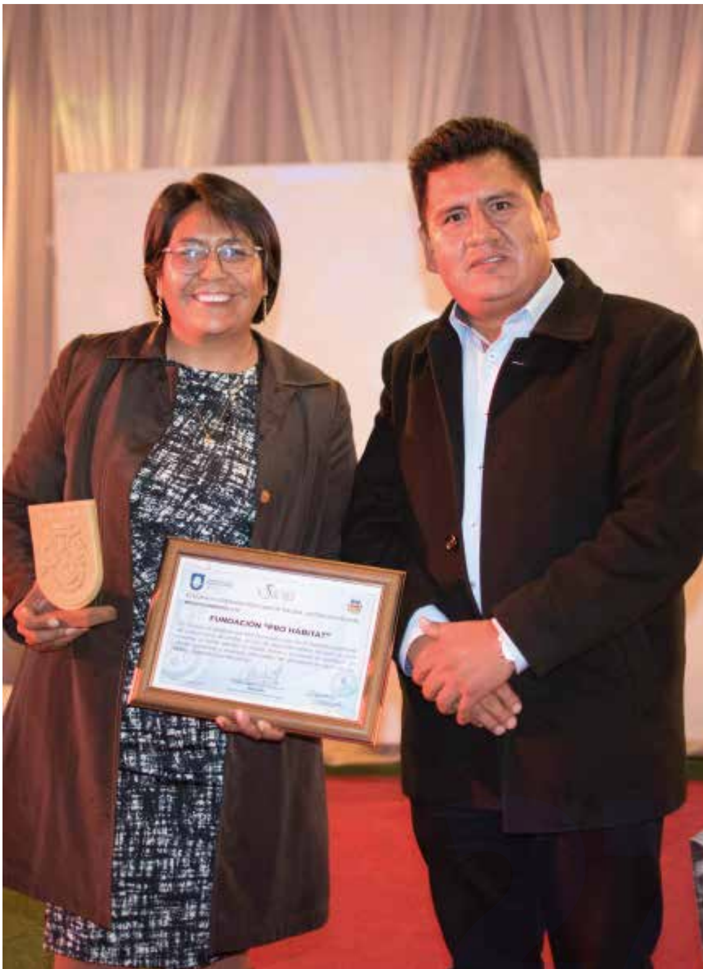
Trigésimo aniversario de la Fundación Pro Hábitat, 2022