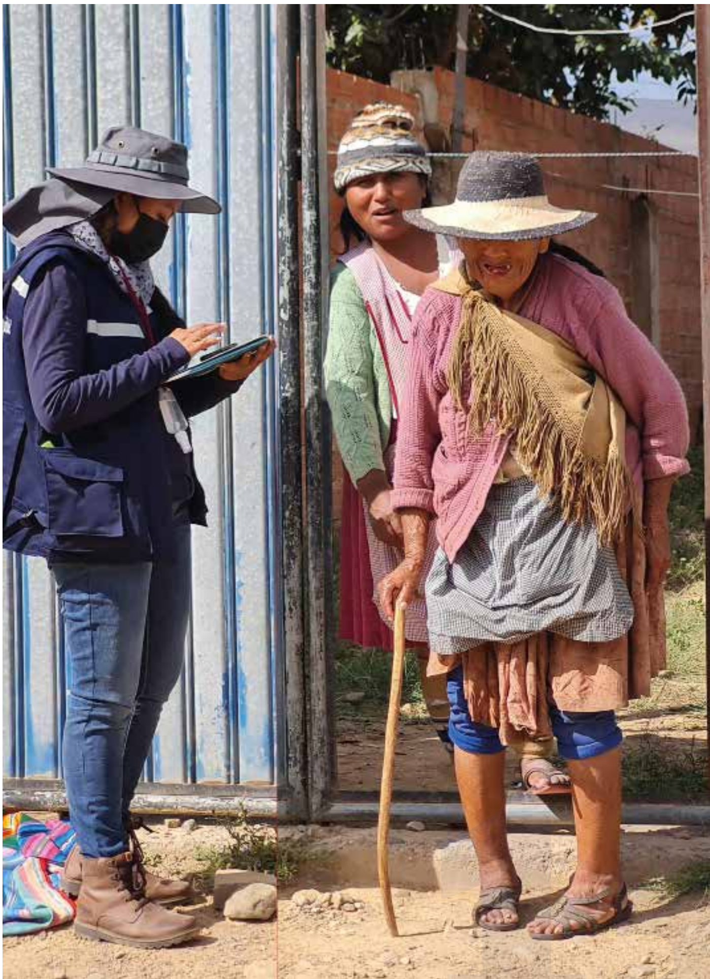
Encuestas Socio-ambientales, Torrentera Waycha Mayu, 2022