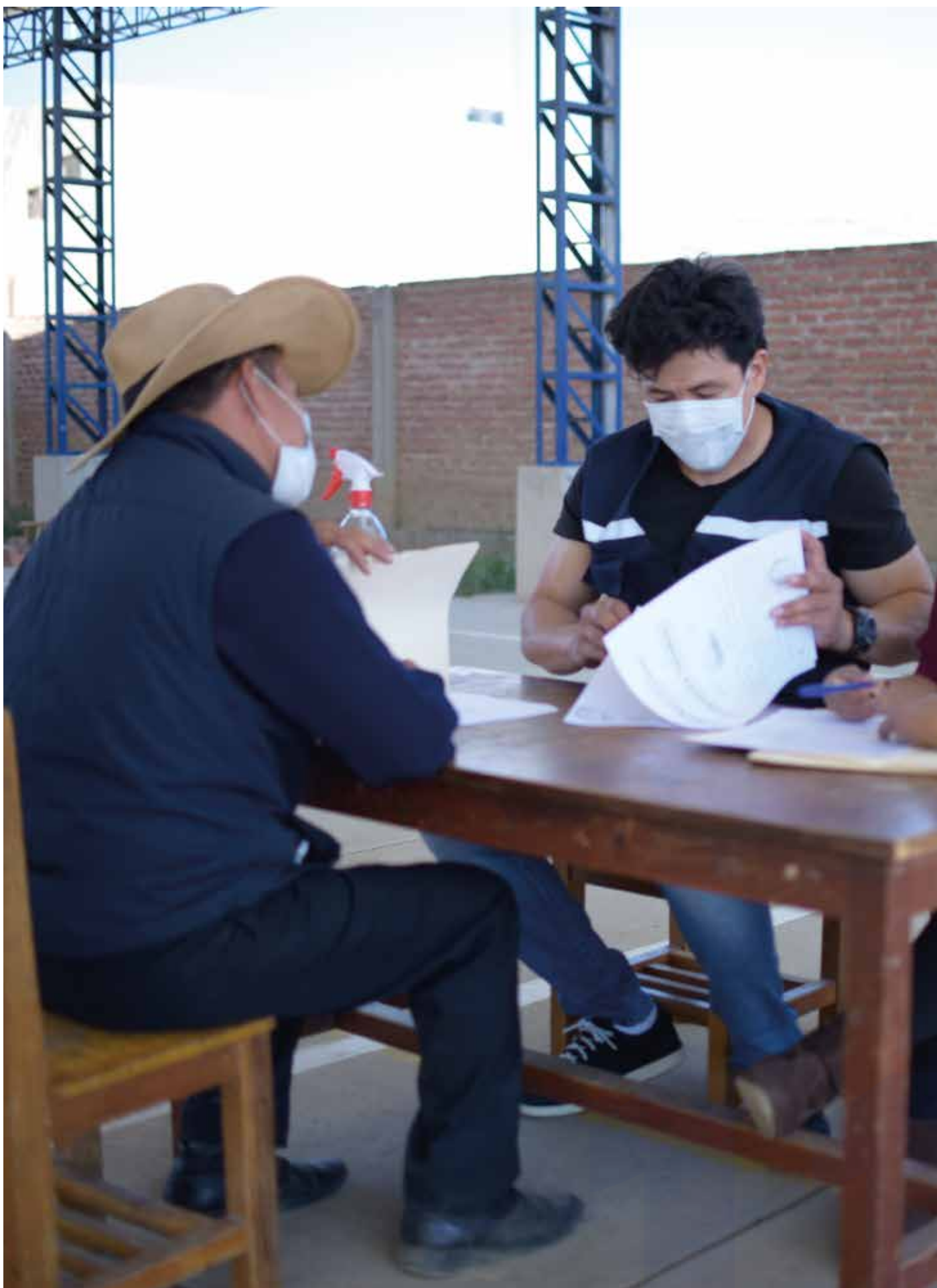
Revisión de documentos junto con promotores SUMO, OTB Canalpata 2021